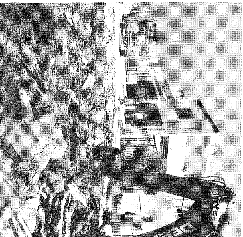
Mejoran vialidades en Juárez.